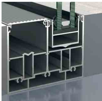
Schüco Schiebesystem ASS 39 PD.NI Schüco Sliding System ASS 39 PD.NI

Ungedämmtes Aluminium Schiebesystem Non-insulated Aluminium Sliding System